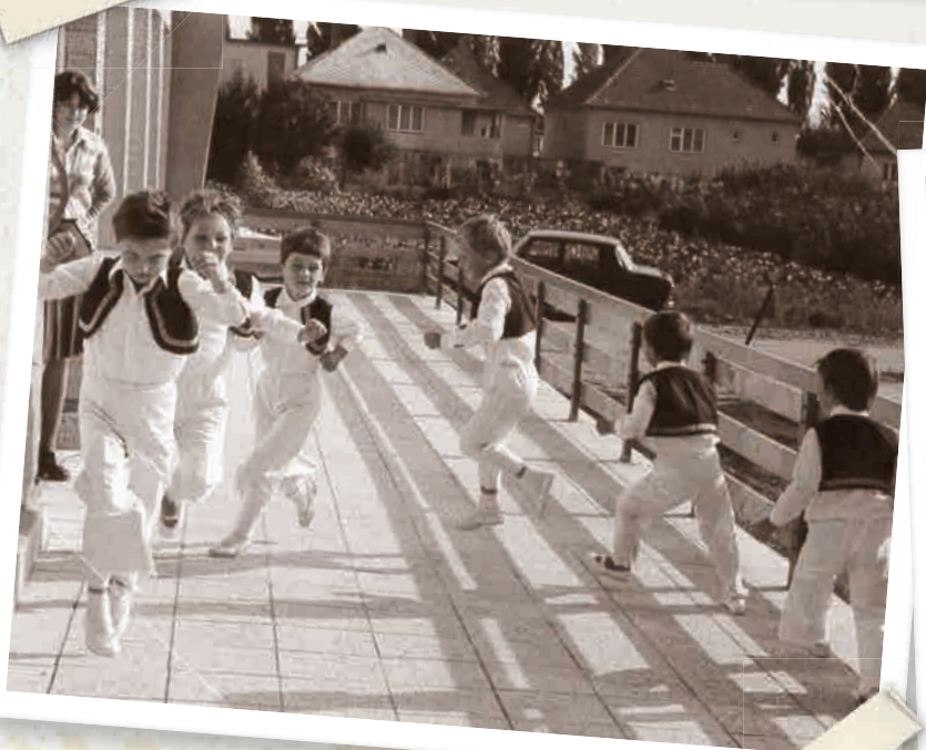
Deti v krojoch a sviatočné dni v obci patrili jednoducho k sebe. Ani dnes tomu nie je inak. Kroje z dobovej fotografie nosia aj dnešné deti pri vystúpeniach v materskej škole.