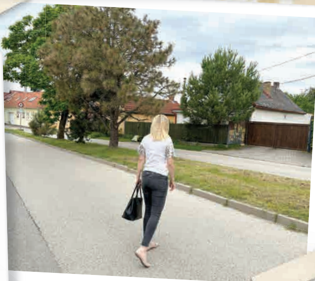
Zima kedysi a leto dnes na Tešedíkovej ulici.

Hostinec Ivák na križovatke ulíc Československých tankistov a Záhorskej má už takmer storočnú históriu. Kedysi viedla okolo neho hlavná cesta z Bratislavy do vzdialenejších záhorských obcí.