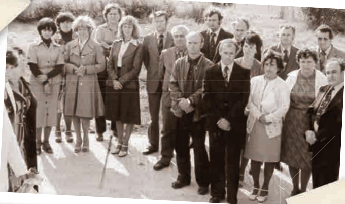
Fotografia pri príležitosti otvorenia materskej školy. Koho na nej spoznávate?