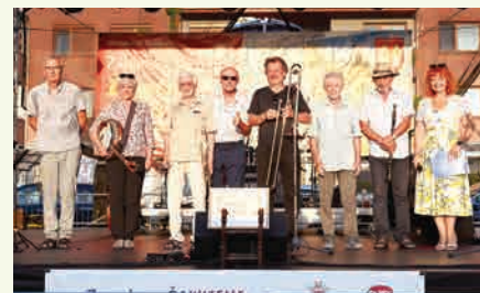
Ragtime Jazz Band odštartovali program Hrubých hodov.