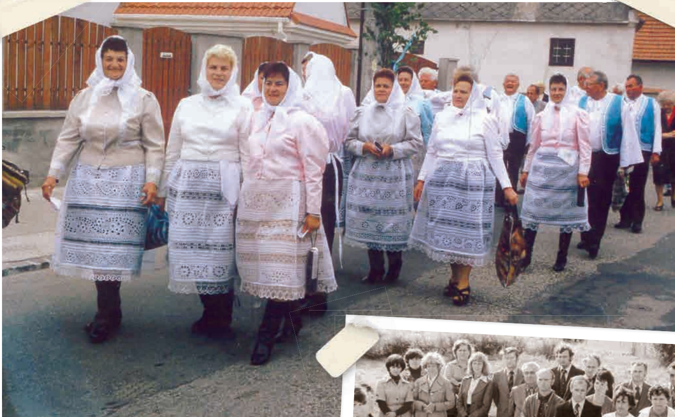
Veselica v krásnych záhorskobystrických krojoch. Čitatelia, ktorí nám pošlú mená aspoň dvanástich Bystričaniek a Bystričanov zachytených na fotografii, dostanú symbolickú odmenu.