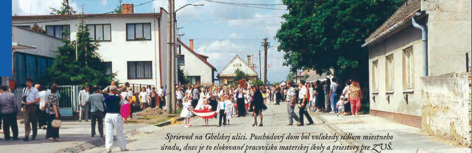
Sprievod na Gbelskej ulici. Poschodový dom bol volakedy sídlom miestneho úradu, dnes je to elokované pracovisko materskej školy a priestory pre ZUŠ.