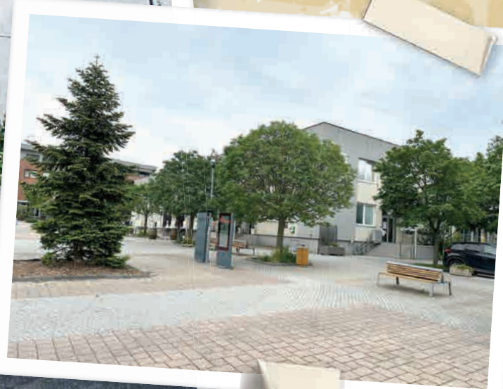
Budova miestneho úradu a samotné námestie prešlo veľkými zmenami. Volakedy pneuserois, od roku 2007 sídlo miestneho úradu a Spoločenský dom. Rekonštrukcia námestia sa uskutočnila v roku 2006.