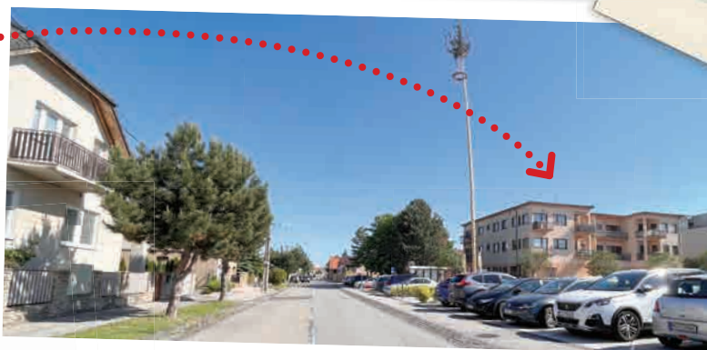
Verili by ste, že budova na obrázku pred kostolom je zdravotné stredisko na Námestí Rodiny?