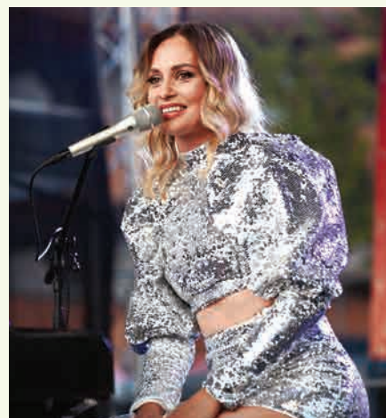
Mária Čirová sa po skončení vystúpenia venovala aj fanúšikom.