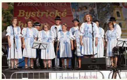
Spevácky zbor Bystričan počas svojho vystúpenia.