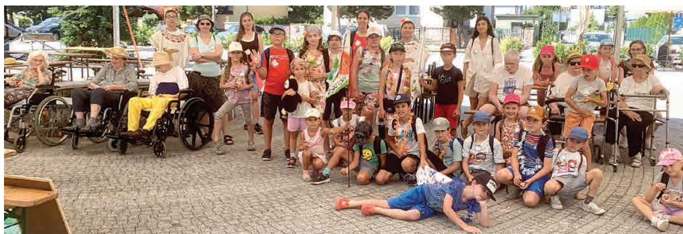
Autor: Dagmar Lendelová

Súkromná materská škola na ul. Donská 119 prijíma v školskom roku 2025 deti od 2 do 6 rokov. Materská škola zabezpečuje predprimárne vzdelávanie a je zaradená v sieti škôl a školských zariadení Ministerstva školstva Slovenskej republiky.