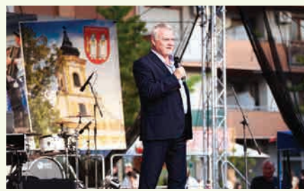
Bystričanom zaspieval aj operný spevák, Bystričan Miroslav Dvorský.