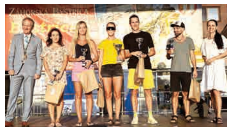
Bežci z kategórie 40+.

Autor: mir