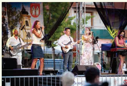
Koncert kapely Znej.