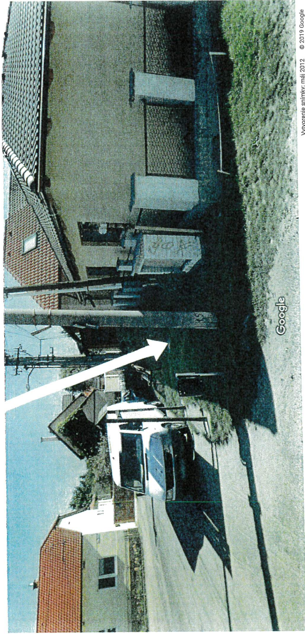
Vytvorenie snímky: máj 2012