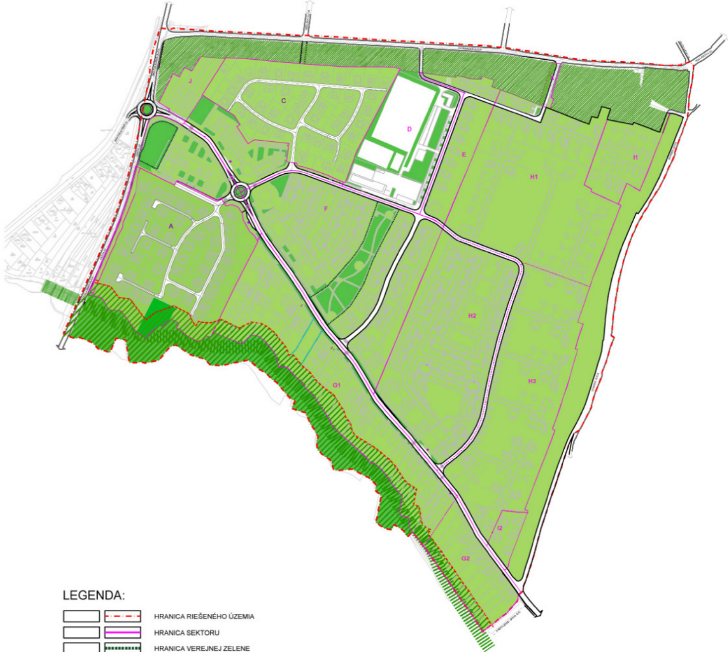
SCHÉMA ZÁVÄZNÝCH ČASTÍ RIEŠENIA