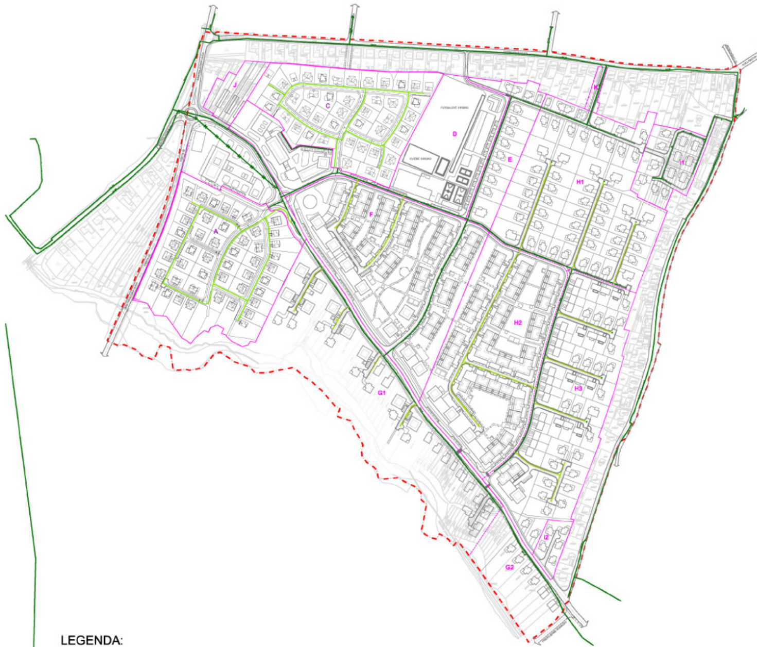
SCHÉMA ZÁVÄZNÝCH ČASTÍ RIEŠENIA